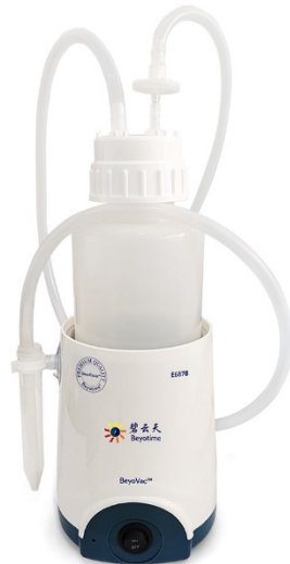
图1. 碧云天BeyoVac™基础型台式真空吸液器(E6878)示意图。